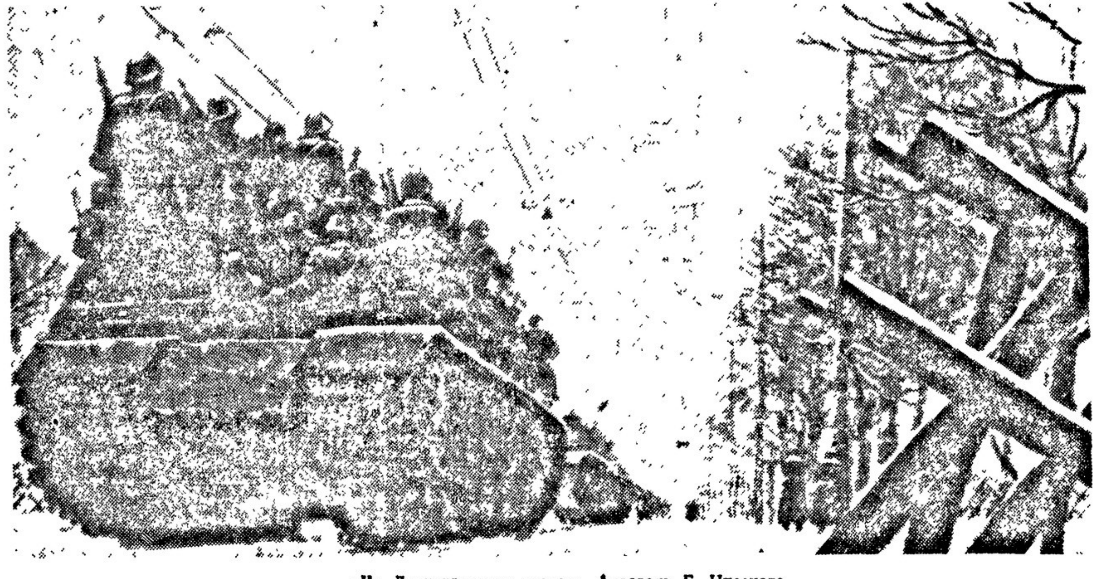
«На Ленинградском шоссе». Акварель Г. Нисского. Выставка «Работы московских художников в дни великой отечественной войны».